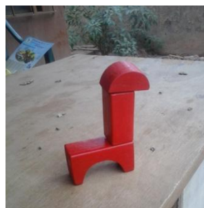
Jeux de construction

Nous vous remercions très chaleureusement pour votre soutien si précieux pour continuer l'action et nous vous invitons à trouver autour de vous des gens qui vous ressemblent.